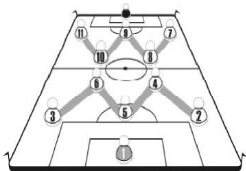
Figura 1: Sistema WM

Os zagueiros passaram a não adotar mais a antiga posição de um à frente e outro atrás, para passarem a jogar lado a lado, procurando, obter as vantagens da estratégia do impedimento. Esta medida ocasionou o surgimento do sistema WM, que tinha estruturação 3-2-2-3 e, é considerado pelos estudiosos do futebol como o ponto de partida para todos os demais sistemas modernos [1] .